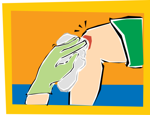
2. Cure debidamente el lugar lastimado.