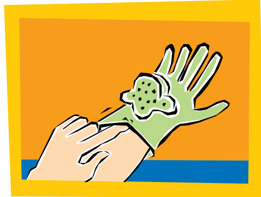
4. Enrolle el guante sucio en la palma de la otra mano enguantada.