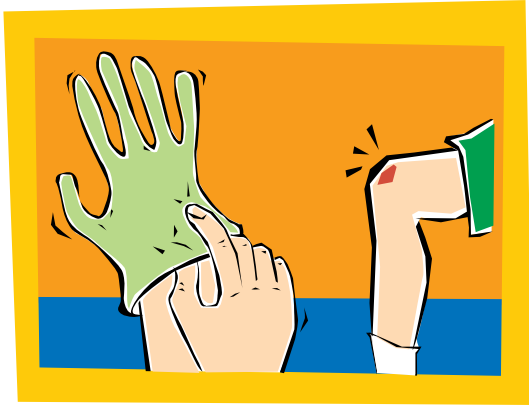
1. Póngase un par de guantes limpios.