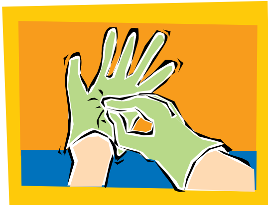
3. Quítese cuidadosamente cada guante. Agarre el primer guante por la palma y sáquese el guante. Toque superficies sucias solamente con superficies sucias.