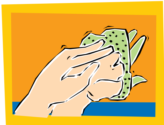
5. Meta la mano limpia debajo de la manga del guante por la muñeca, volteando el guante al revés. Toque superficies limpias solamente con superficies limpias.